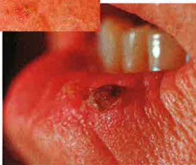
Spinaliom an der Unterlippe

Aktinische Keratosen zeigen sich als raue, flache rötliche Hautstellen, die der Sonne verstärkt ausgesetzt sind. Sie können sich unter Hautpflege und Sonnenschutz teilweise zurückbilden, die stärker ausgeprägten Stellen bleiben aber stets erhalten. Sie sind in der Regel besser tast- als sichtbar.