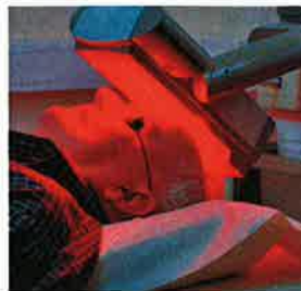
Entfernung mittels photodynamischer Therapie

Für die Behandlung grösserer Hautareale eignet sich die photodynamische Therapie. Hierbei wird eine Crème aufgetragen, die bevorzugt von den Tumorzellen aufgenommen wird und eine erhöhte Lichtempfindlichkeit bewirkt. Nach drei Stunden Einwirkzeit wird die Haut mit einer starken Rotlichtquelle bestrahlt. Die Strahlen zerstören das bösartige Gewebe. Einige Personen empfinden diese Bestrah-